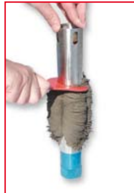
Reinigen van kern